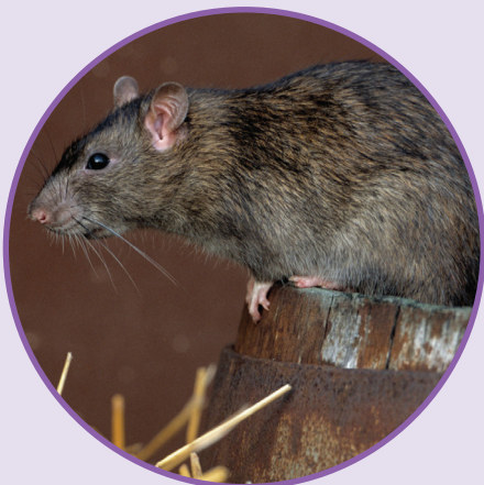
RAT BRUN Rattus norvegicus