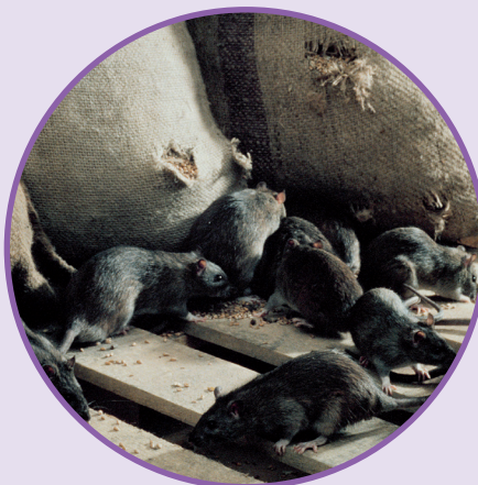
RAT NOIR Rattus rattus