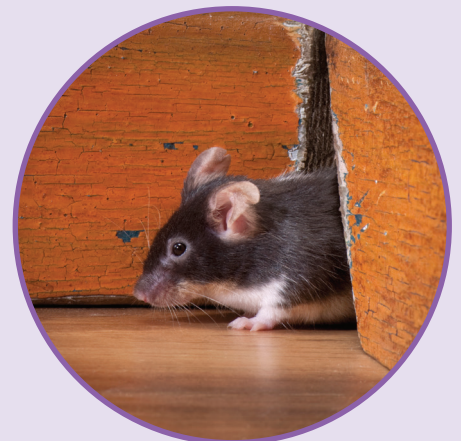
SOURIS COMMUNE Mus musculus